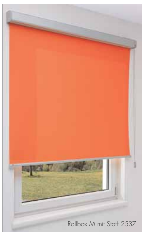
Rollbox M mit Stoff 2537