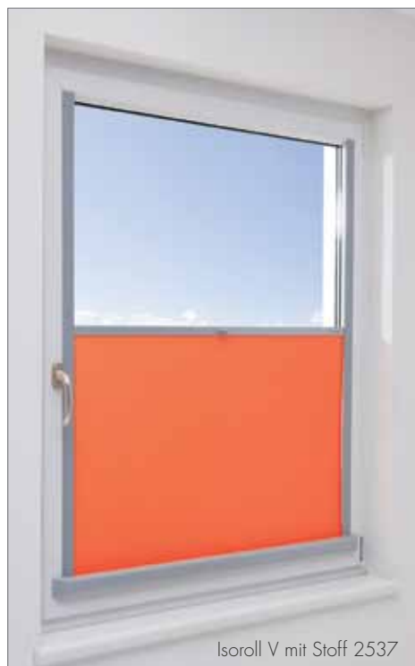
Isoroll V mit Stoff 2537