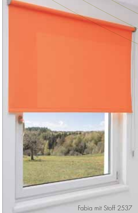
Fabia mit Stoff 2537