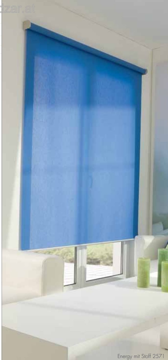
Energy mit Stoff 2571

Grundsätzlich sollten nur versierte Fachkräfte Produkte aus dem Hause WO&WO montieren – nur so können Sie die gesetzlich vorgeschriebene, zweijährige Gewährleistung in Anspruch nehmen.