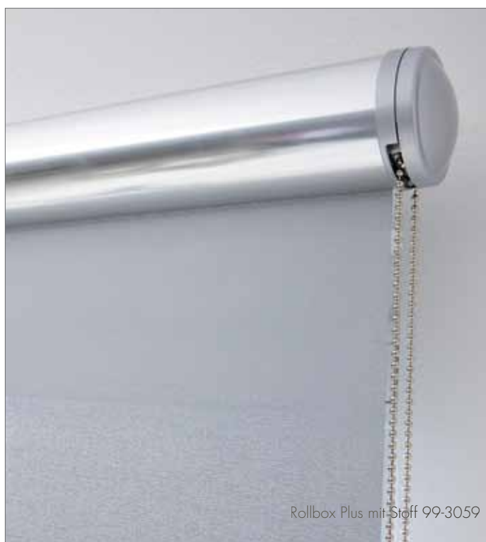
Rollbox Plus mit Stoff 99-3059