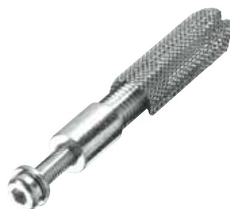
Befestigungsset IM100 für Verbundmörtel